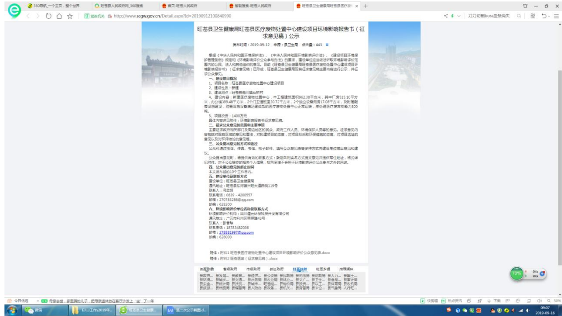
图 2 征求意见稿公示网页截图

该项目环境影响评价第二次网络公示选用载体满足《环境影响评价公众参与暂行办法》等相关要求，网址为： http://www.scgw.gov.cn/PubDetail.aspx?Id=20190912100502-28190-00-000 。网络公示截图见图 2-2。